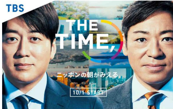
月～金 5:20-8:00 安住紳一郎 香川照之 杉山真也 江藤愛 宇賀神メグ